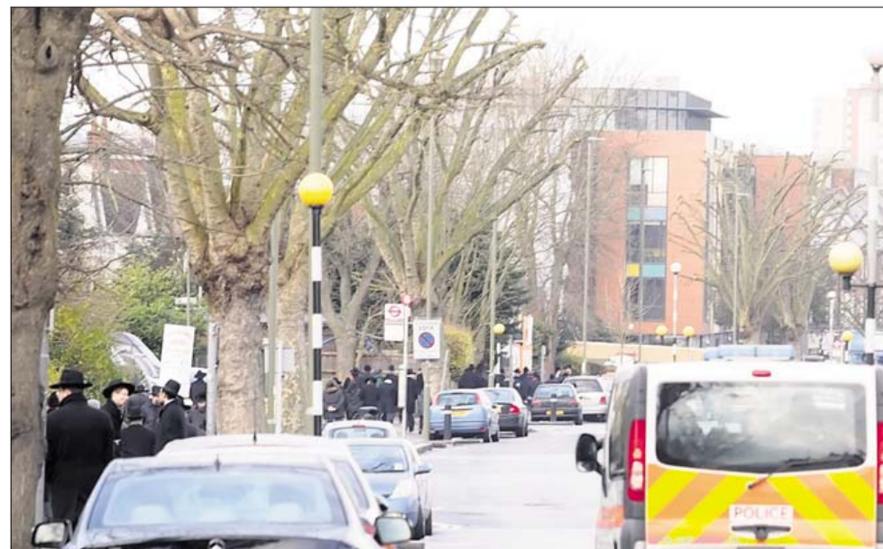
Efter de islamistiske terrorangreb i Paris øgede politiet patruljeringen i jødiske kvarterer overalt i Storbritannien, her i et kvarter i det nordlige London.

Den ortodokse kirke i Ukraine er i dag fortsat splittet. De Kiev-loyale kirker menes at have ca. 14 mio. støtter, mens de Moskva-tro har omkring 9 mio. tilhængere. Under den igangværende konflikt har tonen mellem de to kirker i perioder været særdeles skarp.